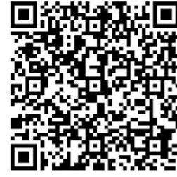
Sabrina Würflein, Inhaberin von Unverpackt in München

Sie haben sich die Podcast-Beiträge angehört. Dabei ist Ihnen aufgefallen, dass viele fachsprachliche Wendungen vorkommen. Sie überprüfen, ob Sie die Aussagen richtig erfasst haben.